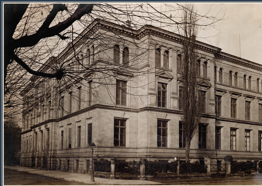
Vue du Musée Zoologique, 1919

Le cabinet d'architecture Freaks associé à l'équipe de scénographes dUCKS scéno a été choisi pour mener à bien cet important chantier.