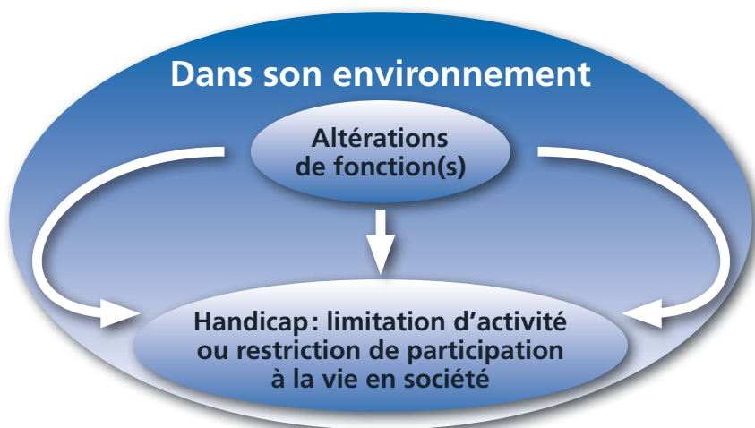
Fig. 2: Définition

Selon cette définition, qui se réclame de la CIF (classification internationale du fonctionnement, du handicap et de la santé – OMS 2001), le handicap ne peut donc plus être uniquement centré sur des caractéristiques personnelles. Étant explicitement défini comme les limitations d'activités et restrictions de participation sociale, il est ainsi le résultat d'une interaction entre deux types de composantes :